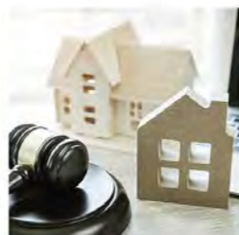
6.5. Miten riitatilanteesta päästään pois?