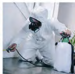
24.3. Tuhoeläimet ja torjunta