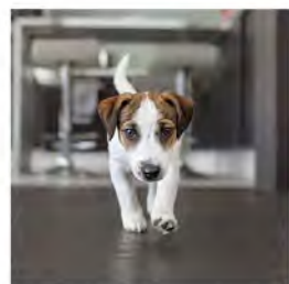
12.4. Homekoirat tehokkaana selvitysapuna