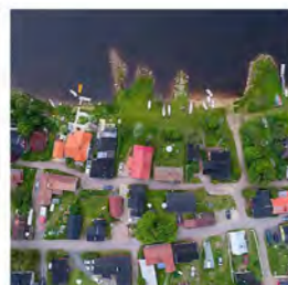
14.4. Omakotiyhdistys kunnan kumppanina