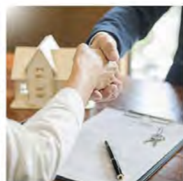
29.3. Ostajan ja myyjän vastuut ja velvollisuudet ennen kauppaa