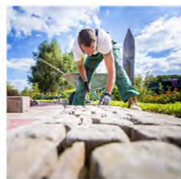
26.5. Kivitoiden toteutus omalla pihalla

K oronaepidemia on muuttanut maailmaa joka suhteessa ja laittanut yritykset ja yhdistyksetkin miettimään toimintatapojaan uusiksi. Miten tavoitetaan ihmiset kun tapahtumia ei voi pitää? Miten saadaan asiaa vietyä eteenpäin, kun ihmisille ei voi puhua kasvotusten?