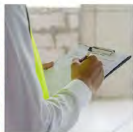
21.4. Kuntotutkimukset virheiden ja korjaustarpeiden määrittelyssä