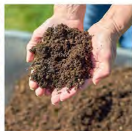
23.3. Kuinka onnistua kompostoinnissa?