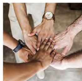
17.3. Paikallisen vaikuttamisen menestystarinoita

Omakotiliitto järjestää jatkuvasti uusia webinaareja eri asumisen aiheista. Webinaari ovat jäsenille täysin ilmaisia ja webinaaritallenteet ovat katsottavissa myös jälkikäteen Omakotiliiton jäsensivuilla.